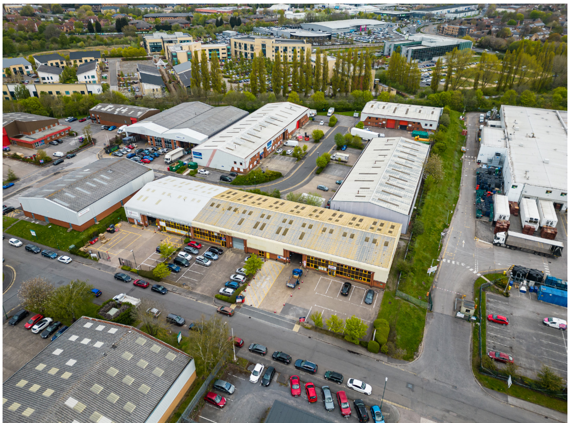
Nottingham, East Midlands 1-3 Longwall Avenue + 1-8 Linkmal Close NG2 1NA, 21.300 sf Nutzfläche

Die Gesellschafter sind grundsätzlich im Verhältnis ihrer Ka-