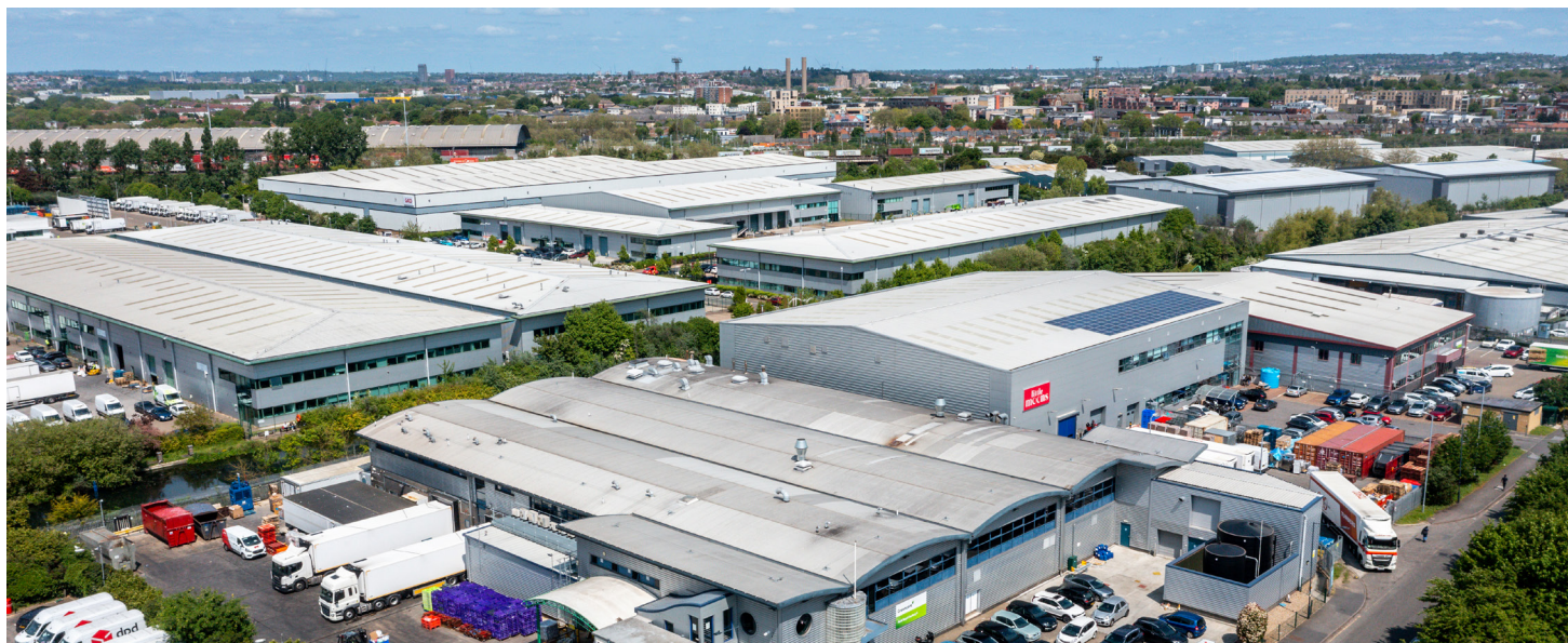
Logistikimmobilie im London Park Royal 8 Willen Field Road NW10 7 AQ Distributionslager Greencore

2022 hatte der gesamte UK-Logistikmarkt laut imarc-Research ein Bestandsvolumen von USD 478,3 Mrd. imarc geht für den UK-Logistikmarkt im Durchschnitt aller Segmente (Verkehr, Produktion, Konsum, Einzelhandel, Telekom, Chemie, Gesundheit, ...) bis 2028 von einer Steigerung auf knapp USD 690 Mrd. aus, 6,18 % p.a. Zum Vergleich: der weltweite