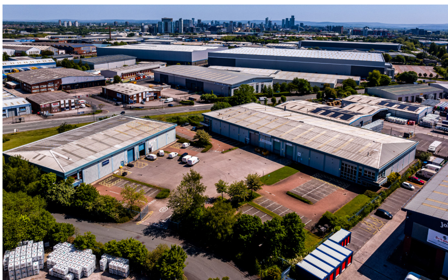
Manchester Trefford Industrial Parks, Marshall Stevens Way M17 1PP Nutzfläche 121.900 sf

Die Economic Forecast Agency taxiert den Pfundkurs zum Euro zwischen ca. GBP 0,85 (2023) und GBP ca. 0,80 pro Euro