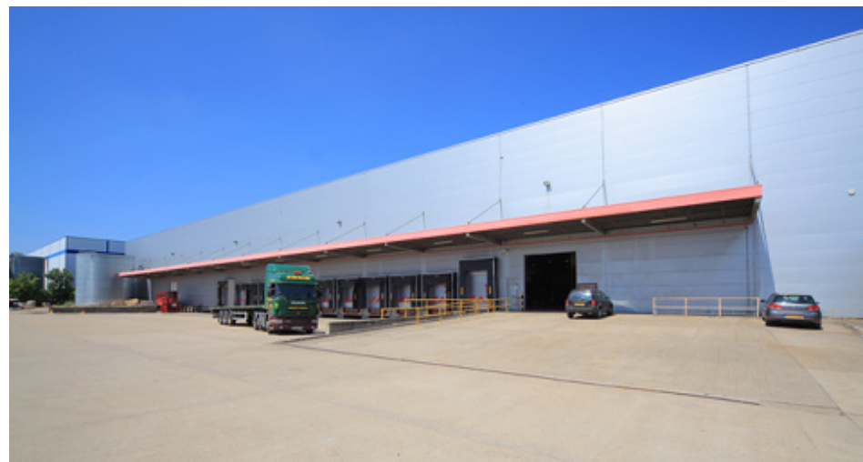
Milton Keynes/Brinklow 90 Standing Way, Nutzfläche 80.300 sf

In einer Umgebung von Mietern wie GXO Logistics, Tesco, Costco, Waitrose, Amazon, Royal Mail, Kuehne & Nagel und John Lewis liegt das 52 Meilen vom Zentrum Londons ent-