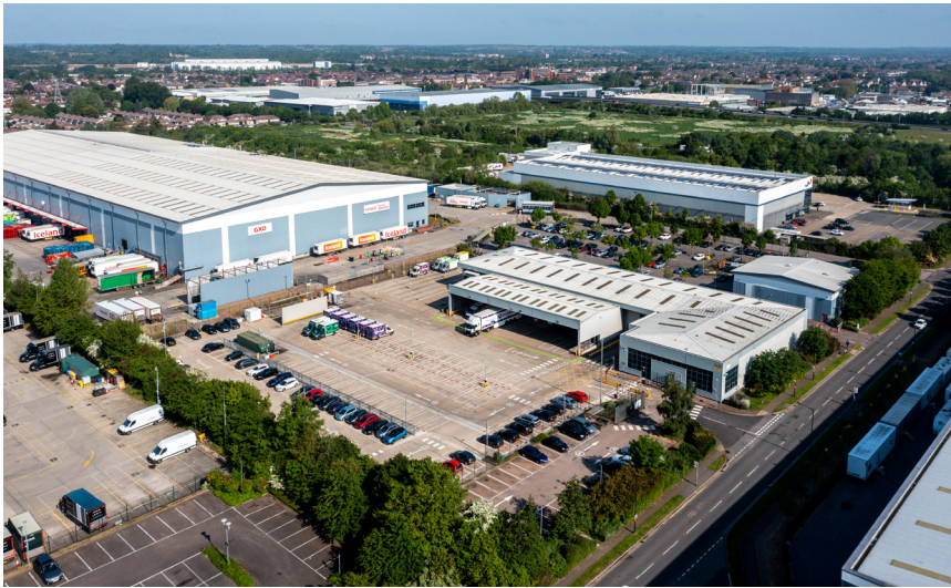
Enfield Innova Park 3 Solar Way EN3 7XY, 22.000 sf Nutzfläche

Studie vom August 2022 zufolge in der East Midlands Region eine historisch niedrige Leerstandsrate von 0,3 % auf (iceni: Nottinghamshire Core & Outer HMA Logistic Study). Die vorhandenen Logistikflächen sind faktisch vollständig absorbiert. Funktional wäre eine Marktverfügbarkeit von 5 % der Flächen für Ab-, Zuwanderung und Standortwechsel. Selbst unter Einbeziehung sämtlicher umliegender Industrieflächen beträgt die Leerstandsrate der Studie zufolge auf Basis von CoStar-Zahlen per Ende 2021 unterdurchschnittliche 2,7 %, deutlich unter der erforderlichen Marktverfügbarkeit.