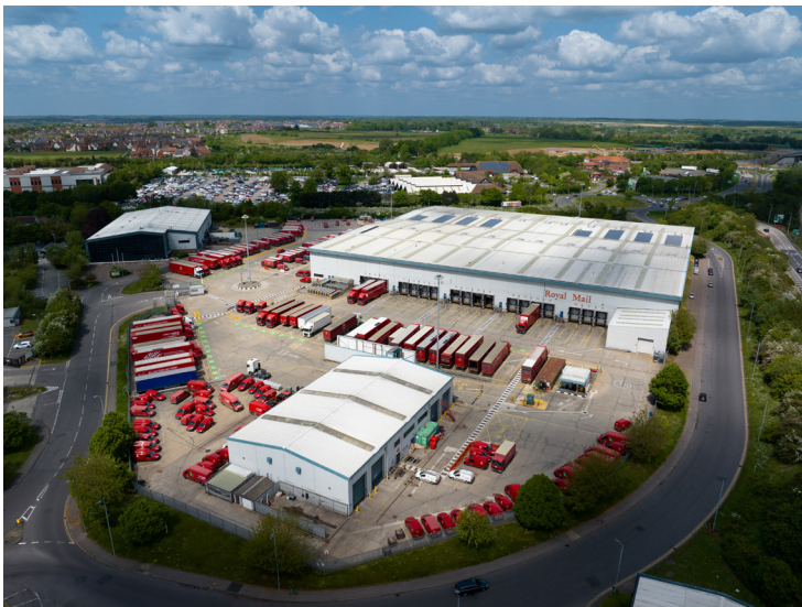
Chelmsford, Essex, Winsford Way CM2 SPD